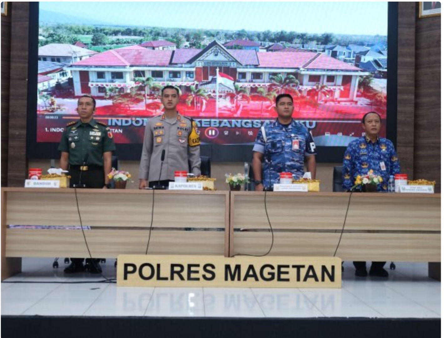
Dandim 0804/Magetan Hadiri Rakor Lintas Sektoral kesiapan operasi lilin 2024

Magetan. – Guna meningkatkan Sinergitas dalam rangka kesiapan operasi lilin