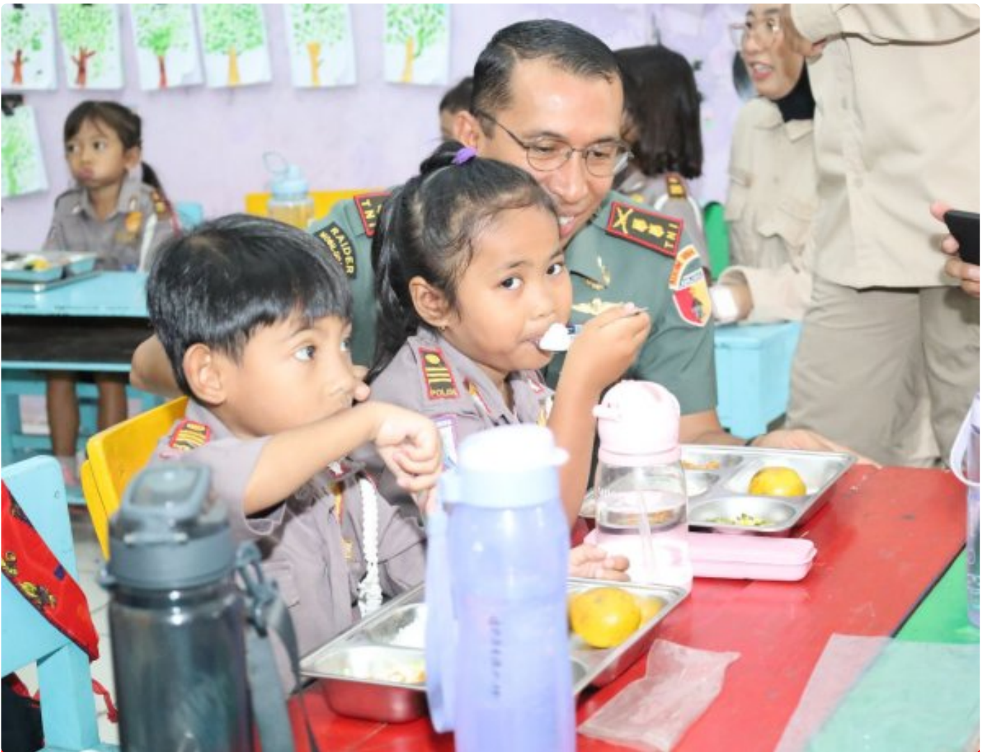
Dandim 0804/Magetan Bersama Forkopimda Dampingi Pemberian Uji Coba Makanan Bergizi Gratis